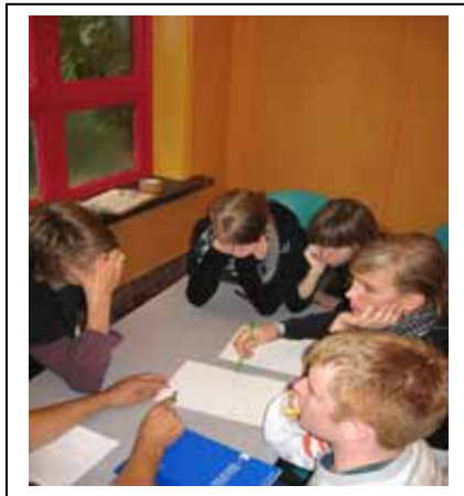
Travail sur la charte