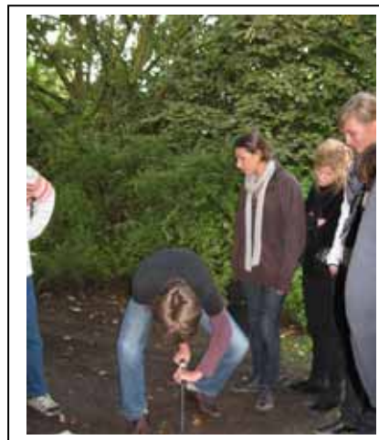
Question de géologie...